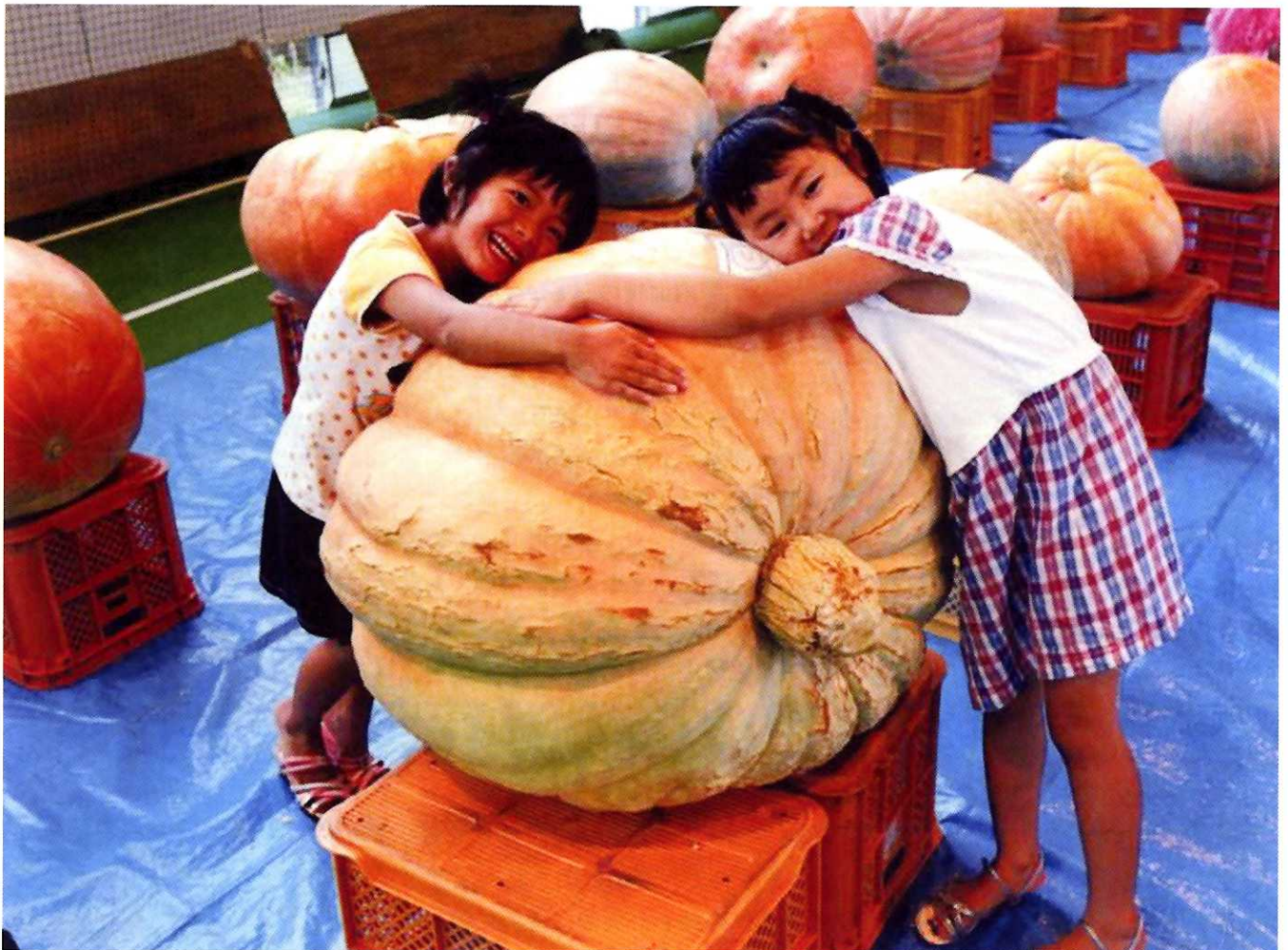
第2回水土里ネット笹川写真コンテスト最優秀作品